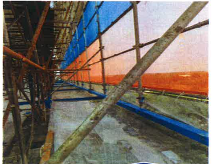
3. ติดตั้งผ้าใบเพื่อป้องกันฝุ่นละออง