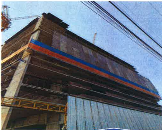
3. ติดตั้งผ้าใบเพื่อป้องกันฝุ่นละออง