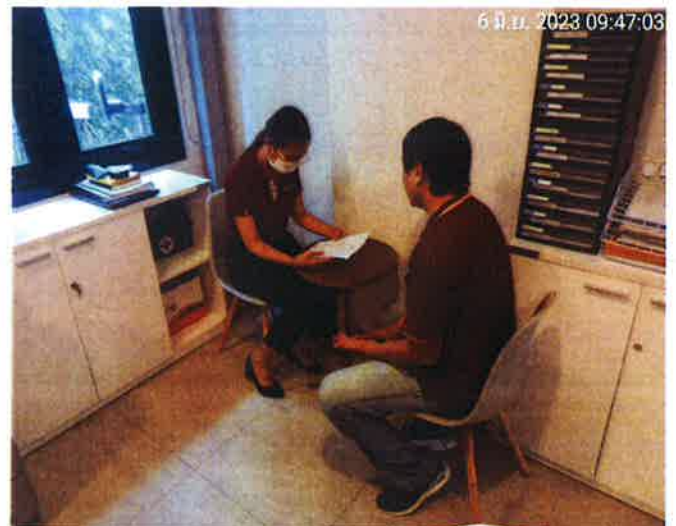
2. พูดคุยเกี่ยวกับปัญหาไฟแสงสว่างเคาน์เตอร์และฝุ่นละออง