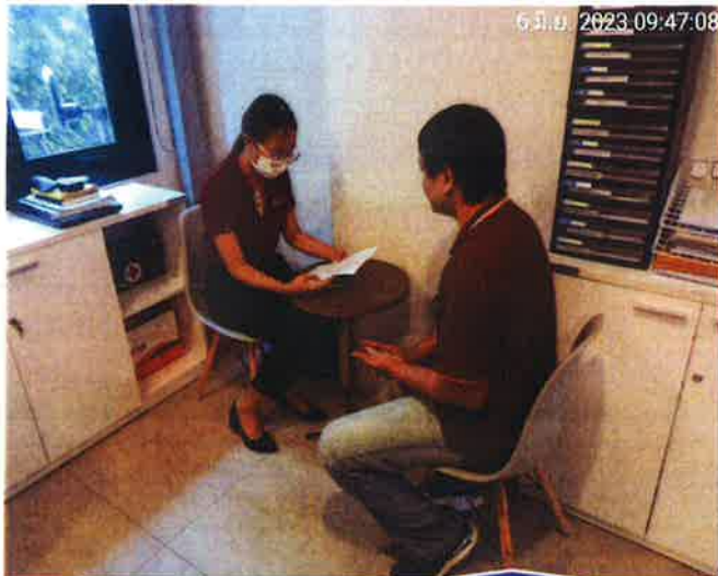
1. พูดคุยเกี่ยวกับปัญหาระยะเวลาการทำงาน และ เสียงดัง